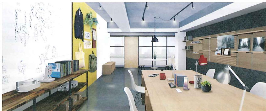
個室内の利用例を描いたイメージパース。テナントはここにある壁材、棚、机、ホワイトボードなどを選んで設えることができる

上—フリーアドレス席も兼ねたラウンジ。ここを利用して小規模なイベントを開催することも可能はテナントが希望したホワイトボードが設置されている 中— 来客時に使用できるミーティングルーム(有料)。4名用と8名用の2部屋を用意している 下— テナントが選択できるカスタマイズメニューの一部